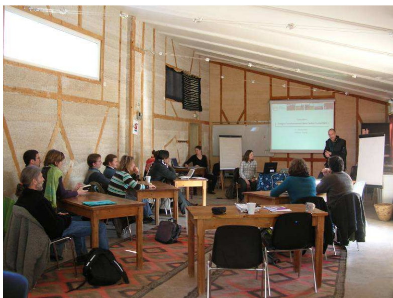
Une formation au siège du Groupe URD à Plaisians (Drôme provençale)

Cette formation s'adresse aux professionnels du secteur de la solidarité internationale gérant des projets et/ou réalisant des évaluations (ex : Chargé de programme, Chef de projet, Responsable Évaluation, Responsable Qualité au sein des organisations humanitaires...).