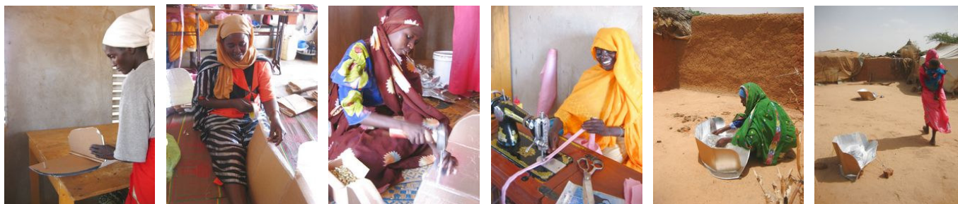
De la fabrication à l'utilisation

Deux évaluations ont été faites sur l'utilisation des cuiseurs solaires : à Iridimi en 2007 par des représentants des donateurs et du UNHCR et à Touloum fin 2008. Selon Tchad Solaire, ces évaluations montrent que l'utilisation des cuiseurs solaires à Iridimi et Touloum est estimée entre 85 et 90 % des ménages. Une troisième évaluation est programmée à l'automne 2009 à Touloum avec des organisations du monde de la cuisine solaire (Solar Cookers International, Solar Household Energy, Bolivia Inti, Kozon...) et un statisticien.