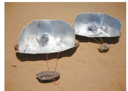
Le cuiseur en fonctionnement dans le camp de réfugiés d'Ouré Cassoni