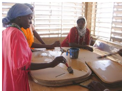
L'atelier de confection dans le camp de réfugiés de Touloum